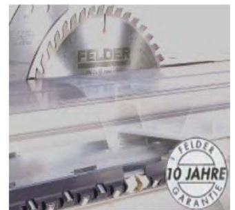
Table coulissante 1300

Chariot coulissant M, longueur de coupe 2500 mm Surdimensionné et prévu pour des charges lourdes, le chariot «X-Roll» est fabriqué selon les technologies les plus modernes qui soient. Les galets sont positionnés en forme de X («X-Roll»), ce qui permet une répartition optimale des forces sur son support. Le coulisement de ces galets en acier sur des rails en acier vous garantit une précision et un coulisement incomparable à ce que vous avez déjà pu essayer! Tout cela n'a qu'un seul but: rendre vos travaux précis et d'une qualité que seul vous pourrez proposer. Un dernier point pour vous convaincre: 10 ans de garantie sur le système de coulisement.